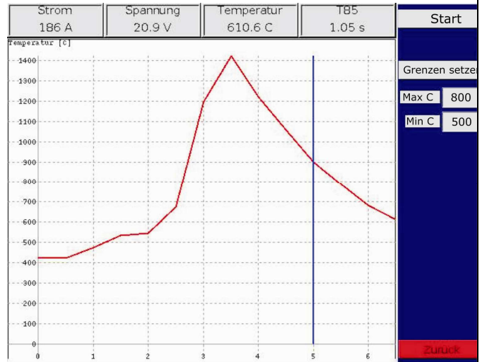
Kurvendarstellung der aktuellen T 8/5-Zeit-Messung

Unabhängig von Auto- oder manuellem Betrieb können bei Bedarf Minimal- und Maximaltemperatur über Grenzen setzen per Rad verändert werden.